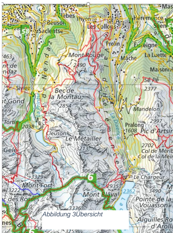
Abbildung 3 Übersicht