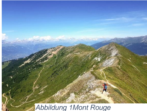
Abbildung 1 Mont Rouge