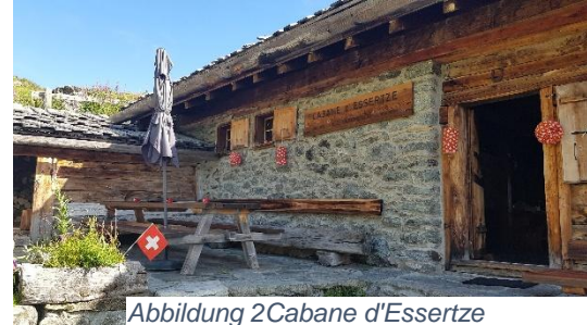
Abbildung 2 Cabane d'Essertze